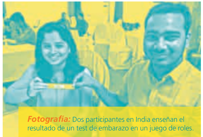
Fotografía: Dos participantes en India enseñan el resultado de un test de embarazo en un juego de roles.

En las páginas 26 a 78 de la guía hay una serie de actividades que se pueden adaptar a diferentes grupos. En una de ellas (ver la foto abajo) los participantes tienen que hacer un juego de roles en el que una joven pareja espera por el resultado de un test de embarazo y se examinan las normas culturales y de género relacionadas con el embarazo, la paternidad, la adopción y el aborto ( páginas 61 a 64 de la guía ).